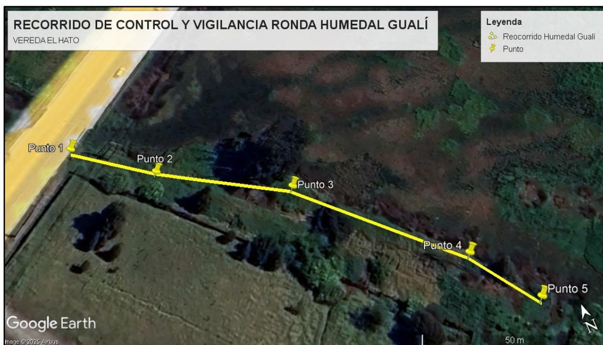
Ilustración 1. Recorrido de control y vigilancia ronda Humedal Gualí

Con base en lo anterior, el día 10 de Octubre del 2025 se realizó recorrido de control y vigilancia ambiental en la ronda del humedal Gualí, vereda El Hato desde las coordenadas 4°43'34.457"N-74°11'30.133"W, hasta 4°43'31.224" N-74°11'26.525" W (ver ilustración 1. Ruta amarilla).