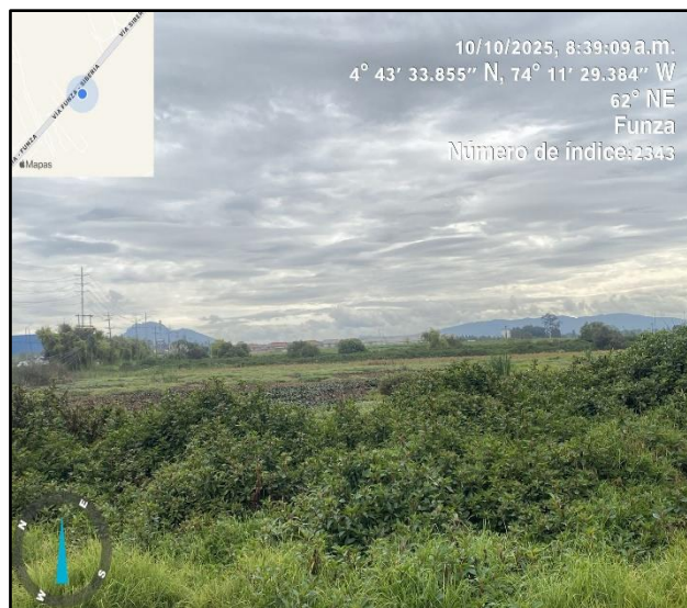
Ilustración 3. Evidencia recorrido punto 2