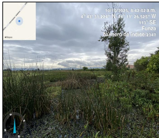
Ilustración 6. Evidencia recorrido punto 5

Elison Ardila ELLISON ARDILA VASQUEZ Contratista CPS05992025