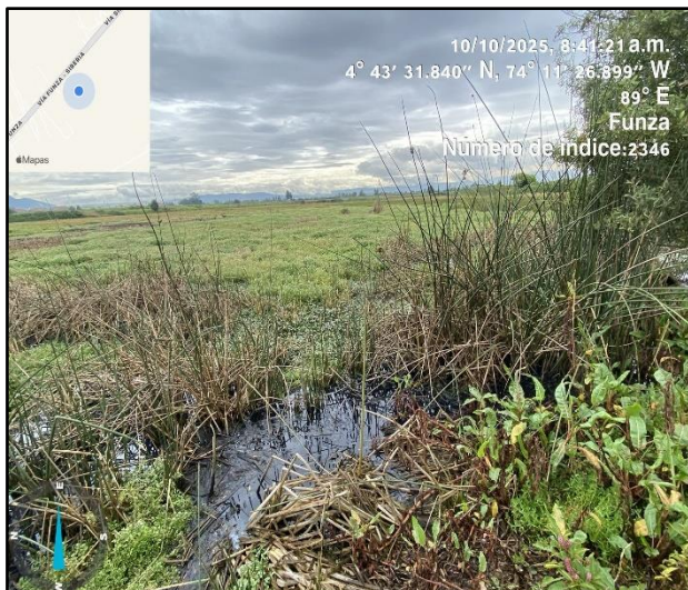
Ilustración 5. Evidencia recorrido punto 4

C.P. 250020 Tel. +57(1) 823 40 70 823 40 71 / 823 40 73 Fax. + 57(1) 825 76 20 Dir. Cra. 14 No. 13-05